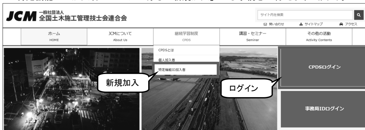
図6 全国技士会のトップページ（各ID共通）( https://www.ejcm.or.jp/ )

特定機能IDは3種類あり、「講習会実施機関ID」「社内研修ID」「社員データID」となります。