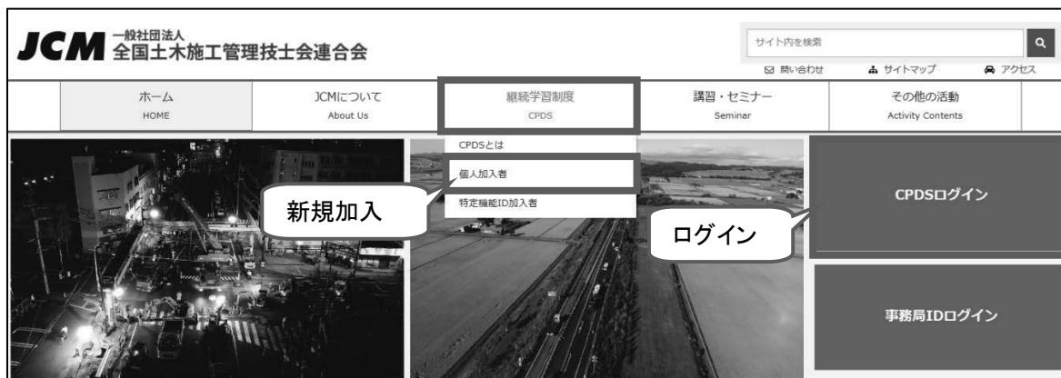
図2 全国技士会のトップページ（各ID共通）（ https://www.ejcm.or.jp/ ）

※個人IDに関する各申請について、インターネット申請が難しい方は有料にて入力代行をいたします。詳しくはお電話（03-3262-7438）にてお問い合わせください。